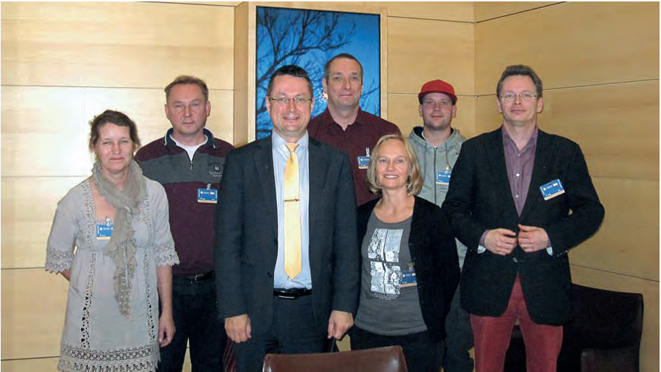
Työapu Lahty ry:n henkilöstöä yhdessä SDP:n kansanedustaja Mika Karin kanssa.