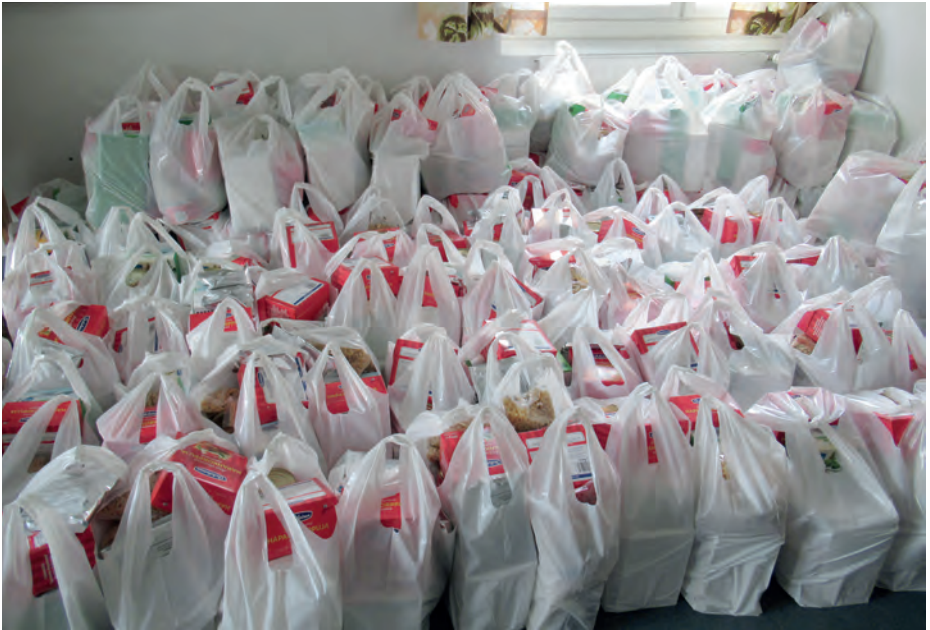
Valmiiksi pakattuja EU-ruoka-apukasseja Apelin avoimissa ovissa.